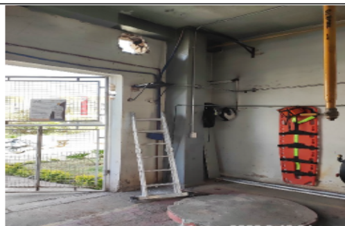
Fotografía 4. Evidencia de caldera marca Tecnick de 50 BHP desmantelada