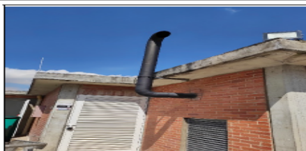
Fotografía 7. Ducto de la planta eléctrica