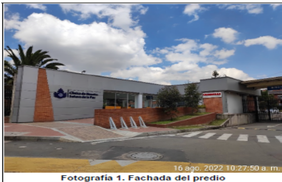
Fotografía 1. Fachada del predio