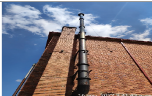
Fotografía 3. Ducto de la caldera Colmáquinas de 50 BHP