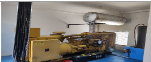
Fotografía 5. Planta eléctrica marca Caterpillar de 225 KVA