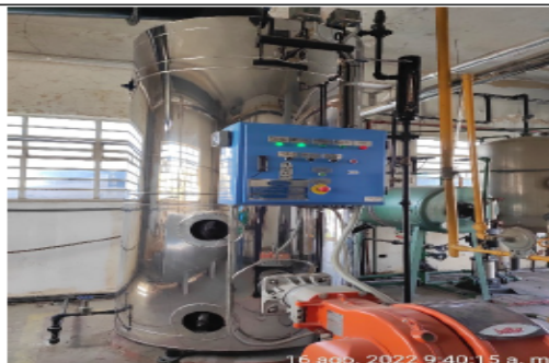
Fotografía 2. Caldera marca Colmáquinas de 50 BHP